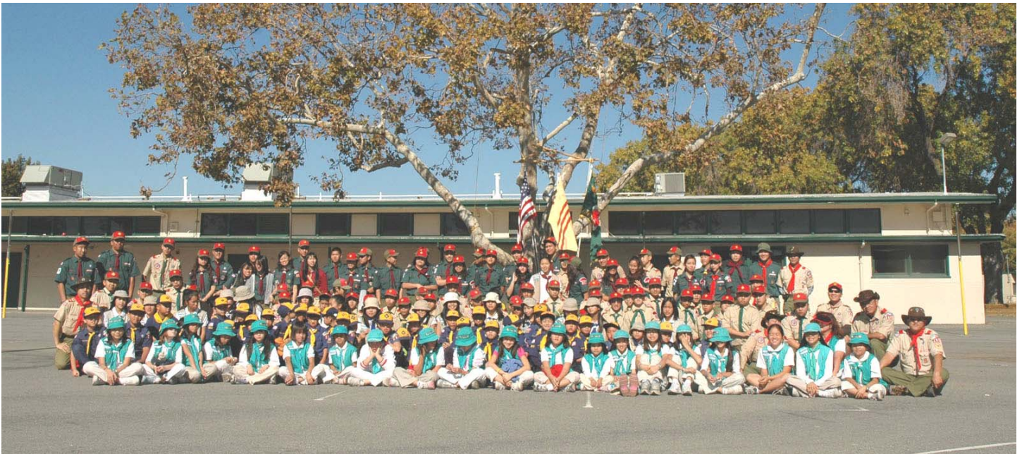
Liên Đoàn Ra Khởi , San Jose, California, USA

Ghi Chú: HĐHK = Hướng Đạo Hoa Kỳ ; BSA = Boy Scouts of America ; HĐ = Hướng đạo ; PT = Phụ Tá ; Tr. = Trưởng HĐVN = Hướng Đạo Việt Nam ; LĐ = Liên Đoàn ; LĐRK = Liên Đoàn Ra Khởi ; GSUSA = Girl Scouts of The USA.